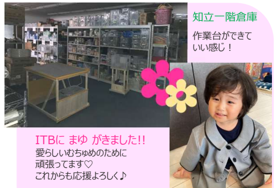
知立一階倉庫 作業台ができて いい感じ!

ITBにまゆがきました!! 愛らしいむちゅめのために 頑張ってます♡ これからも応援よろしく!